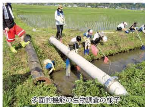
多面的機能の生物調査の様子