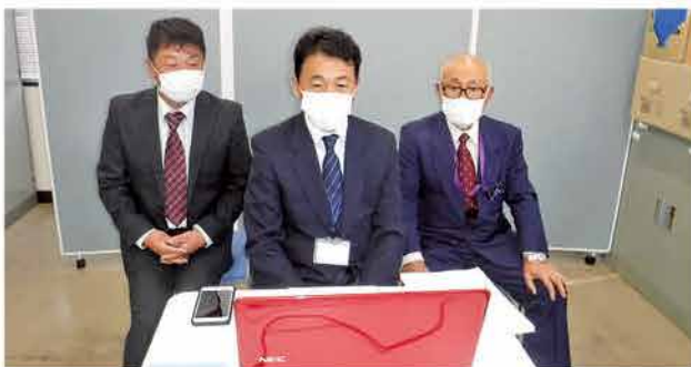
コンクールへは、Zoom形式により参加しました。

東成井西部地区（受益面積25.1ha）は、やさと菜苑と地元担い手を中心に、畑地かんがいを利用した高収益作物の生産拡大に取り組んでいます。