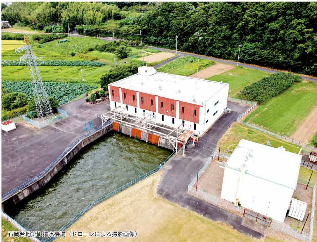
石岡台地第1揚水機場（ドローンによる撮影画像）