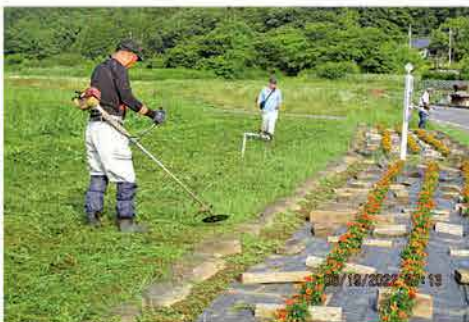
多面的機能支払交付金による草刈り作業