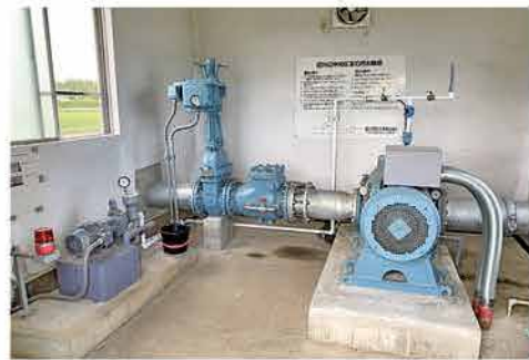
維持管理適正化事業によるポンプの更新