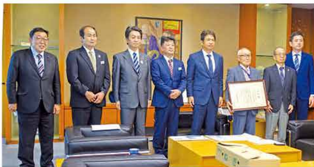
大井川茨城県知事への表敬訪問の様子

東成井西部地区（受益面積25.1ha）は、やさと菜苑と地元担い手を中心に、畑地かんがいを利用した高収益作物の生産拡大に取り組んでいます。