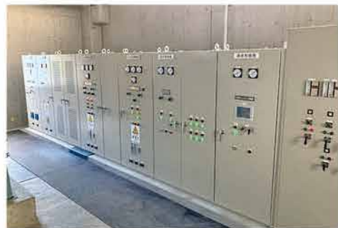
県営ストックマネジメント事業による電気設備の更新