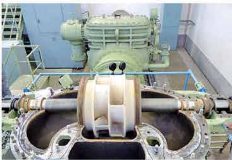
基幹水利受託事業による揚水ポンプの点検整備