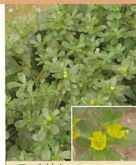
スベリヒユ ・葉の先は丸い ・葉は互生 ・花は黄色