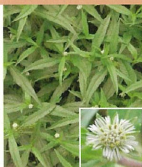
アメリカカタカサブロウ ・葉の鋸歯は明瞭 ・花は球状ではなく平たい