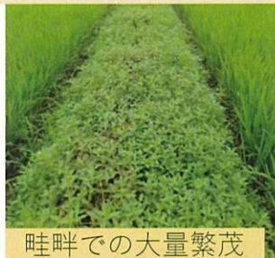
畦畔での大量繁茂