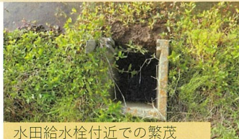
水田給水栓付近での繁茂