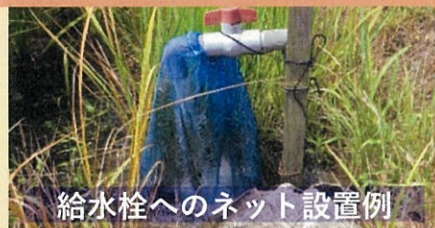
給水栓へのネット設置例