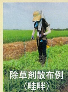
除草剤散布例 (畦畔)